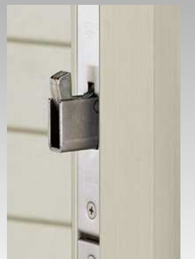
上部錠・下部錠とも 鎌錠です。