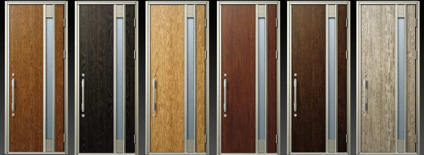
キャラメルテーク(KE) 桑炭(AX) ハニーチェリー(BV) ダージリンウォールナット(AM) ショコラウォールナット(YJ) ココナッツチェリー(XP) 7. 5YR / 4. 3 / 3. 2 9. 9R / 3. 1 / 0. 4 8. 2YR / 5. 9 / 3. 2 1. 1YR / 3. 6 / 2. 4 3. 0YR / 3. 3 / 1. 1 8. 9YR / 6. 1 / 0. 8