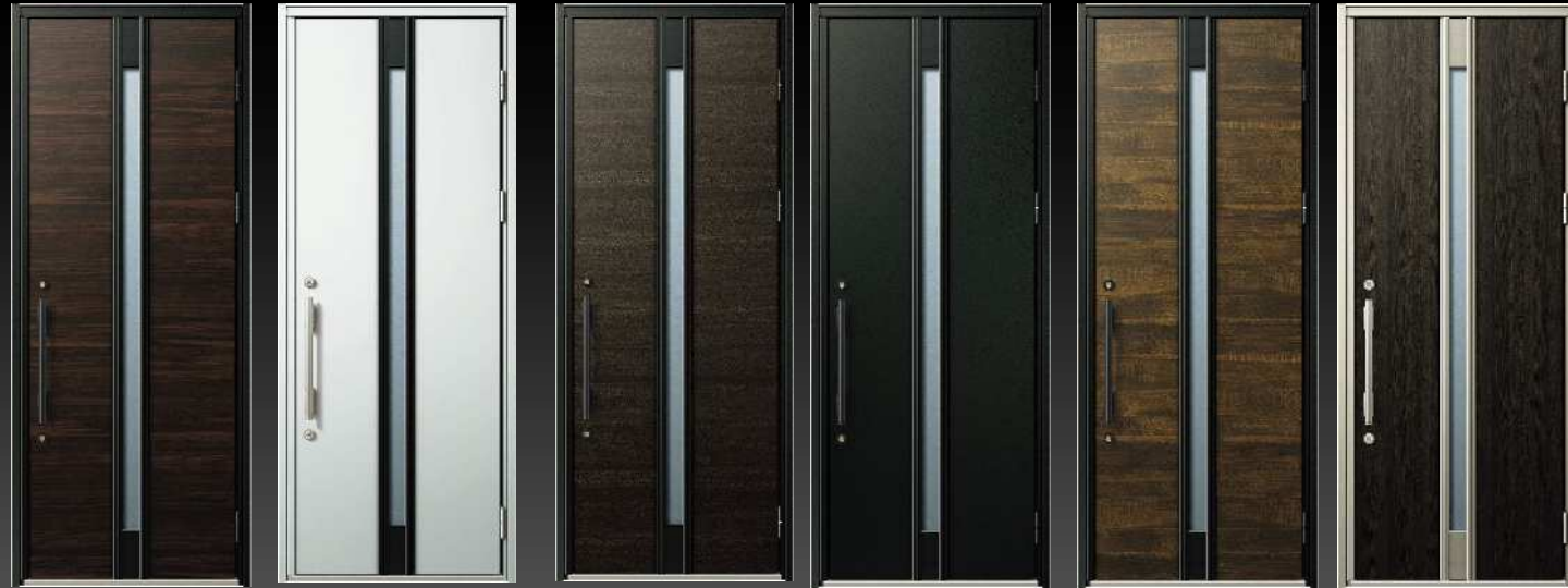
ガトアアジア(AF) ピュアシルバー(S1) ピターストーン(HV) カームブラック(K5) スモークヒッコリー(A8) 桑炭(AX) 6. 8R / 3. 4 / 0. 8 9. 3B / 8. 0 / 0. 1 3. 6YR / 3. 3 / 0. 3 9. 3P / 3. 2 / 0. 3 6. 9YR / 3. 7 / 1. 2 9. 9R / 3. 1 / 0. 4