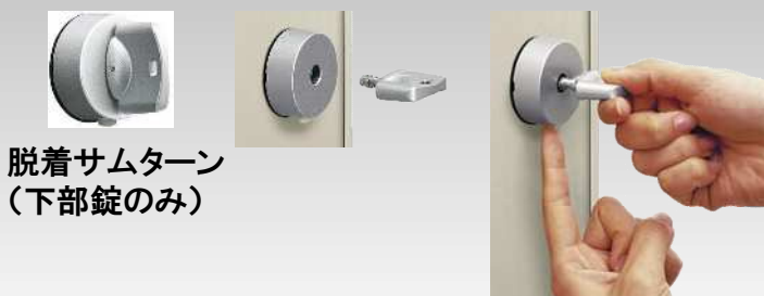
脱着サムターン (下部錠のみ)