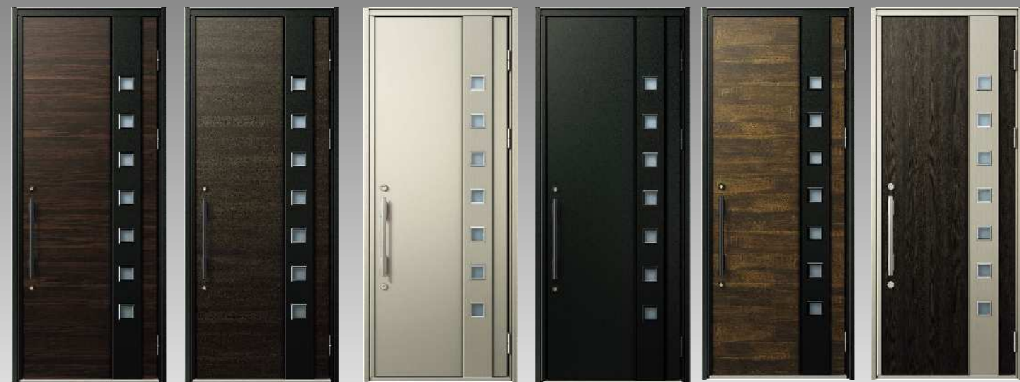
ガトアアジア(AF) ピターストーン(HV) プラチナステン(H2) カームブラック(K5) スモークヒッコリー(A8) 桑炭(AX) 6. 8R / 3. 4 / 0. 8 3. 6YR / 3. 3 / 0. 3 3. 0Y / 6. 7 / 0. 6 9. 3P / 3. 2 / 0. 3 6. 9YR / 3. 7 / 1. 2 9. 9R / 3. 1 / 0. 4