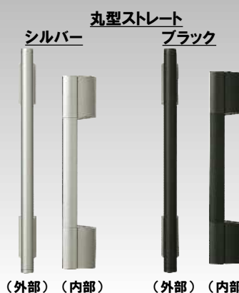
(外部) (内部) (外部) (内部)