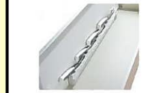
計4本(刃渡り20cmまで:1本・18cmまで:3本)