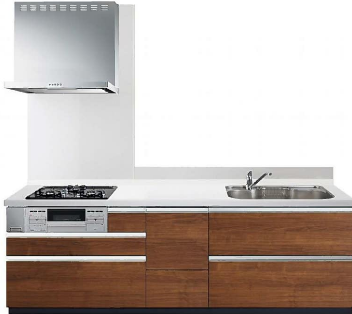
※1) 写真セットは、イメージ写真です。 ※2) 写真セット扉カラーは、HSFです。

スタンダードタイプに、引出しが閉まる直前にスピードをゆるめ、ゆっくりと閉まる「スローインクローズ」を搭載したレールです。耐荷重15kg。 ※ 加納機櫃積15cmのスライスボックスは除く。