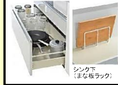
シンク下(まな板ラック)