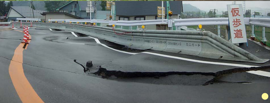
● 2011年3月11日 東日本大震災における浦安市の液状化被害 ● 2004年10月23日 新潟県中越地震による建物や道路の被害